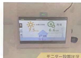
モニター設置状況